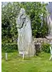
Cromlech de Kergonan, le menhir "Le moine".

Elle est habitée depuis l'époque néolithique. Il subsiste sur cette île 24 menhirs sur les 36 ( 1877 ) ainsi que 2 dolmens.